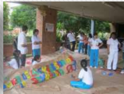
Práctica Comunitaria desde Media y F.C