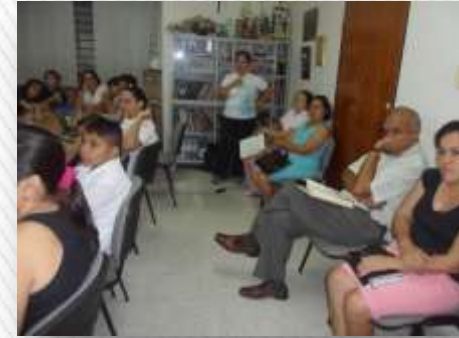
Mesa de trabajo Institucional