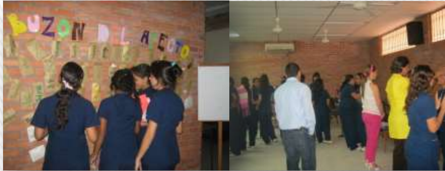
Capacitación a los estudiantes de Formación Complementaria, como multiplicadores de procesos