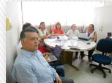
Pertenece al ETM (Equipo Técnico Municipal de BcaBja)