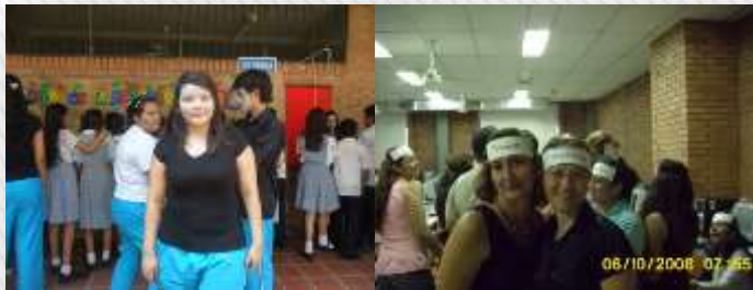
Sensibilización a los estudiantes y maestros